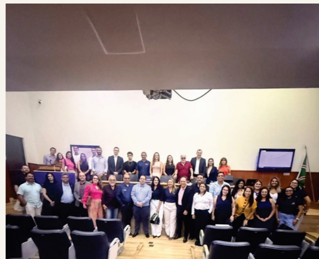
Café + Seguro Excelsior Seguros