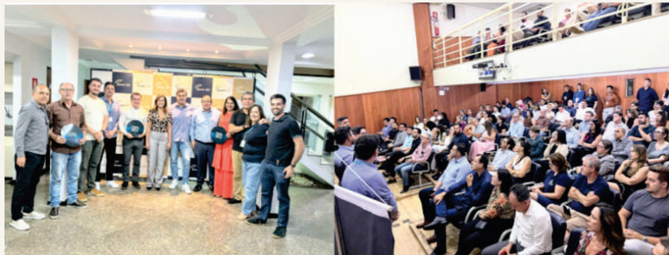
Diretoria do Sincor-GO recepcionou o evento Fecha com a Porto da Porto Seguros.