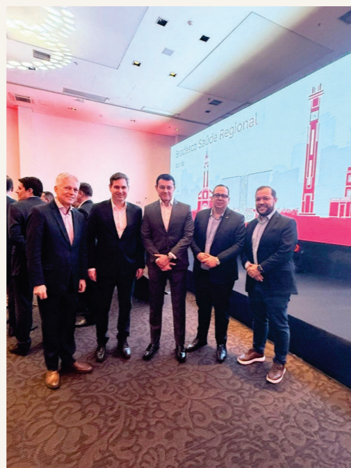
Marcamos presença do evento da Bradesco Saúde para lançamento do seu produto: BRADESCO SAÚDE REGIONAL GOIÁS