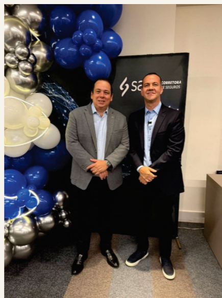
Marcamos presença na entrega do Troféu Boa Fé, promovido pela Saga Corretora de Seguros.