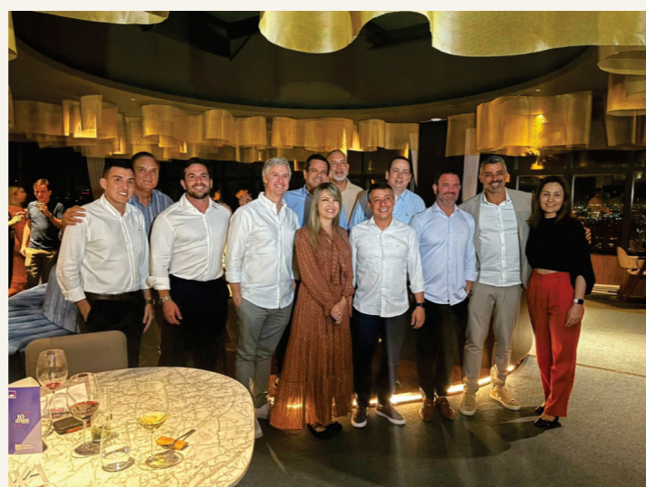
Marcamos presença no Roadshow da AXA 10 anos.