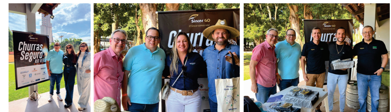
ChurrasSeguro Rio Verde