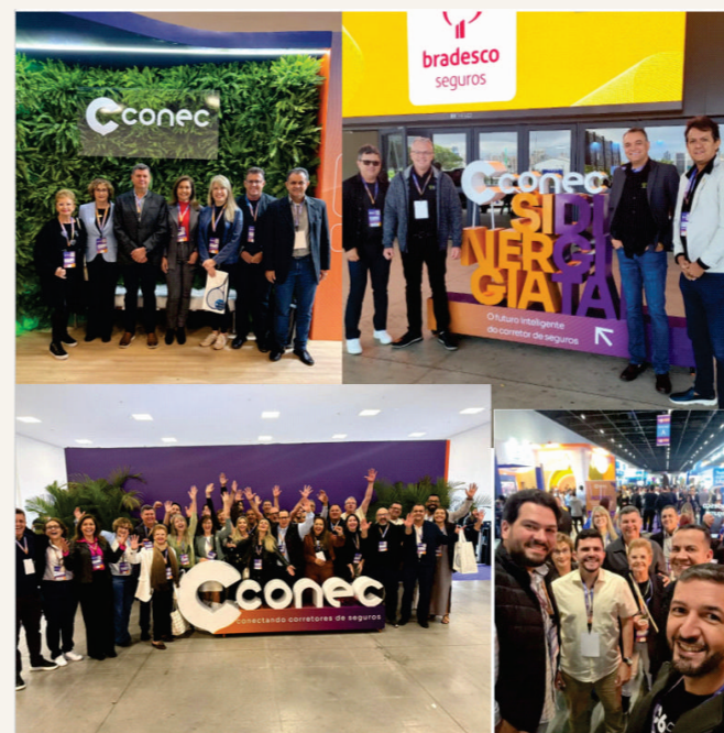
Marcamos presença no CONEC 2025