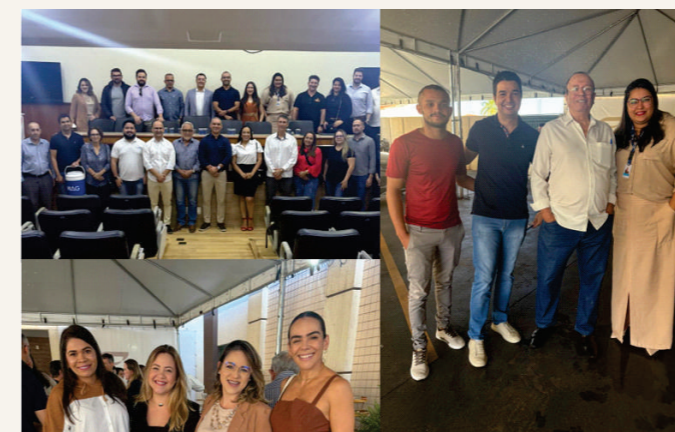
Recebemos a MAG Seguros que trouxe o Tema "Sucessão" para os Corretores de Seguros de Goiás. A apresentação da CIA e dos seus produtos, juntamente com o tema em destaque, foram apresentadas pelos Executivos da CIA.