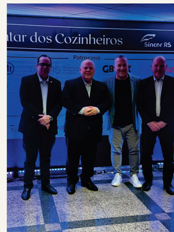
Participamos do 18º Jantar dos Cozinheiros, evento promovido pelo nosso coirmão Sincor RS.