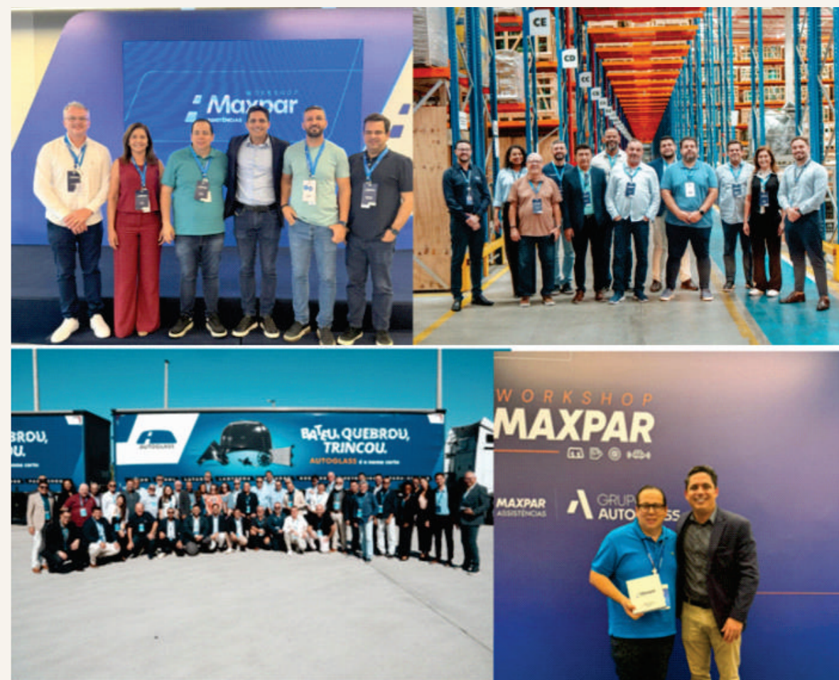
Dirigentes dos Sincor's, a convite da Maxpar, participaram do workshop, com visita técnica para apresentar sua estrutura administrativa e operacional na sede da empresa e o seu centro logístico, no Espírito Santo.