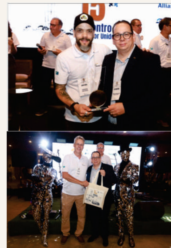
Marcamos presença na 15ª edição do Corretor Unido é + Seguro uma iniciativa do Sincor-MS