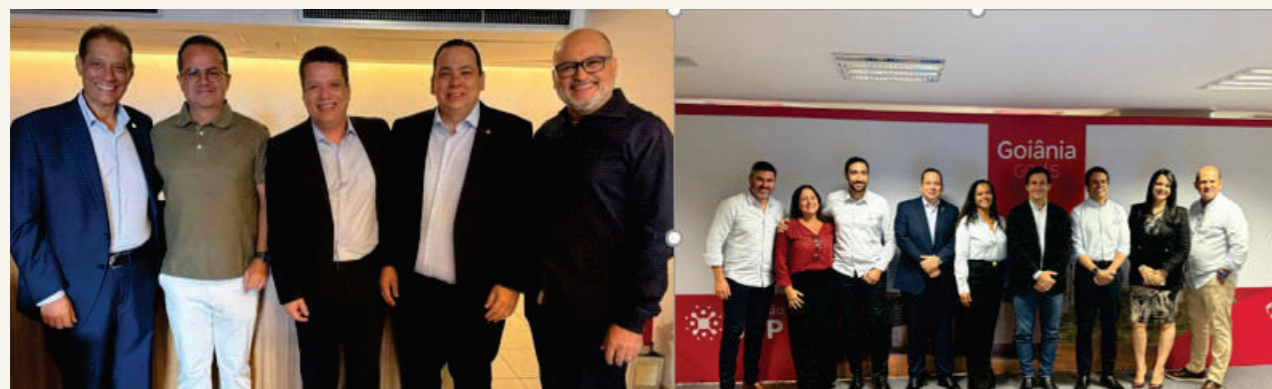
Estivemos no evento Conexão Bradesco, onde debatemos temas essenciais como proteção familiar, previdência privada e planejamento financeiro. Um verdadeiro mergulho nas oportunidades do setor!