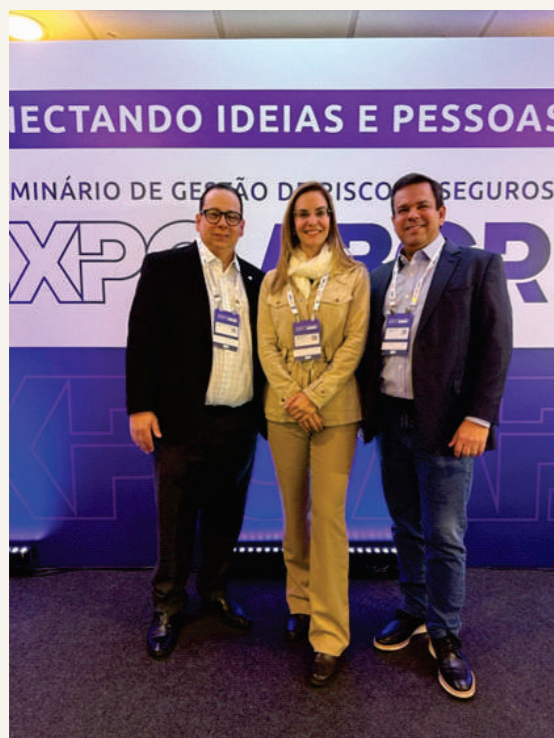
Nossa diretoria marcou presença na EXPO ABGR e no XVI Seminário de Gestão de Riscos e Seguros