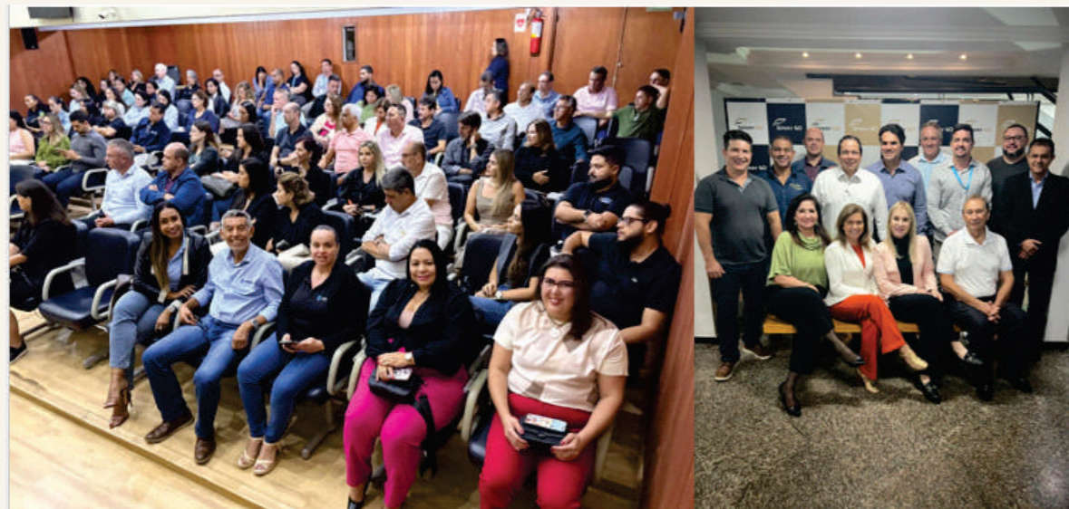
Recebemos o evento da Porto para a Palestra: Marketing Digital e Inteligência Artificial para Corretores e Sinistro Auto.