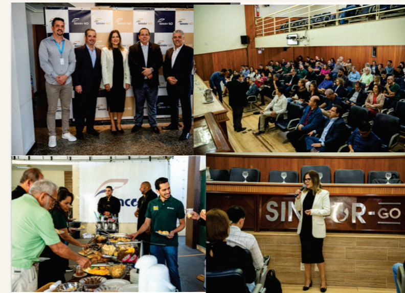
Recebemos o Sindseg MG/GO/MT/DF para o debate sobre o Marco Legal dos Seguros, sancionado pela Lei nº 15.040/2024 que visa modernizar a legislação sobre contratos de seguro,