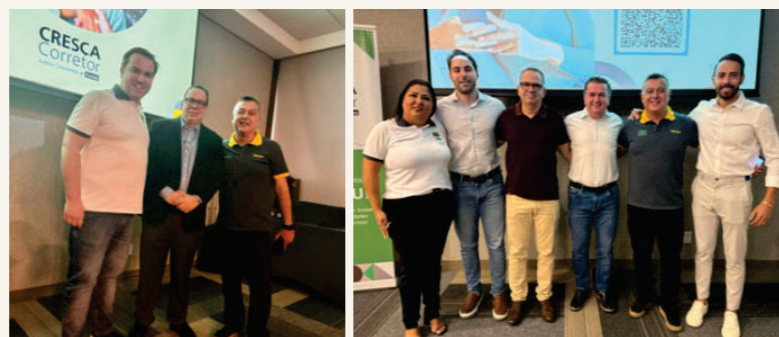
Marcamos presença no evento do Grupo HDI Seguros.