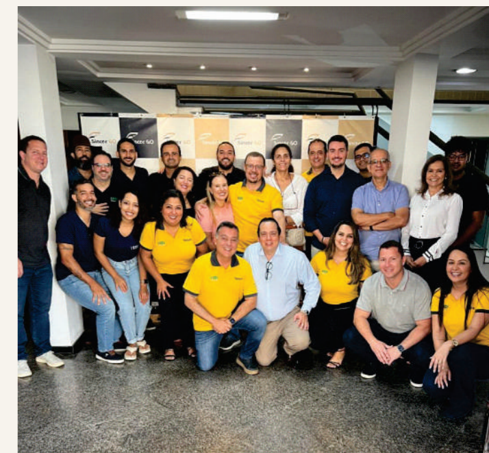
Encontro Regional Grupo HDI Seguros no Espaço Sincor.