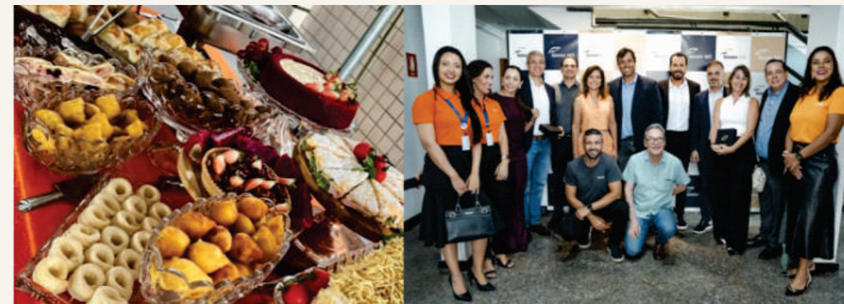
Delicioso café da manhã com a Castro Corretora de Seguros, para falar sobre oportunidades de negócios em Planos de saúde.