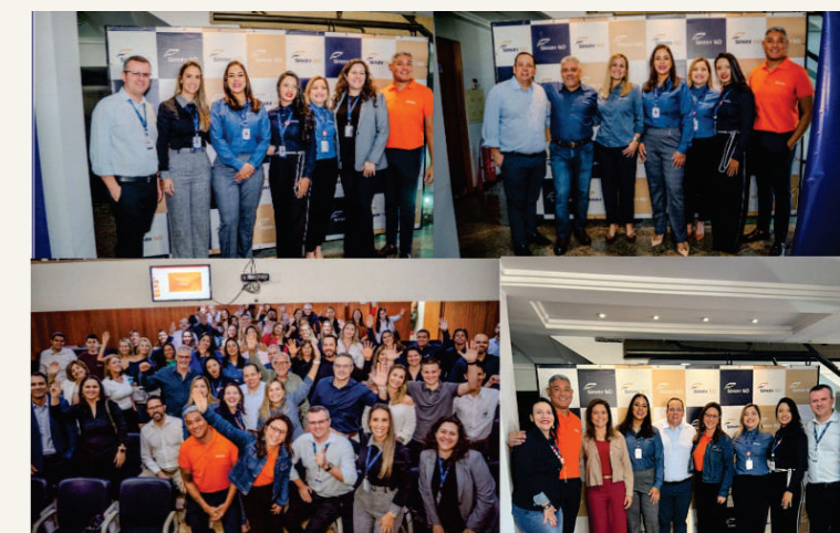
Café + Seguro com SulAmérica Saúde! A SulAmérica marcou presença no nosso Espaço Sincor e compartilhou novidades quentíssimas para o mercado de Goiânia. Troca de ideias, networking e muita informação de valor!