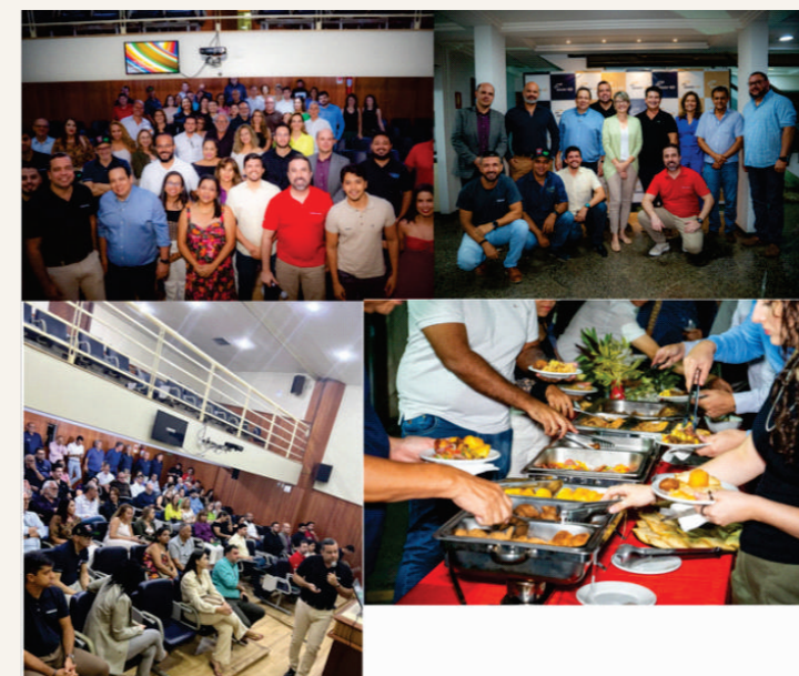
Mais um encontro de sucesso com os Corretores de Seguros no Espaço Sincor (a Casa do Corretor)! - Roadshow Mapfre para apresentação de novidades da CIA e do novo diretor regional.