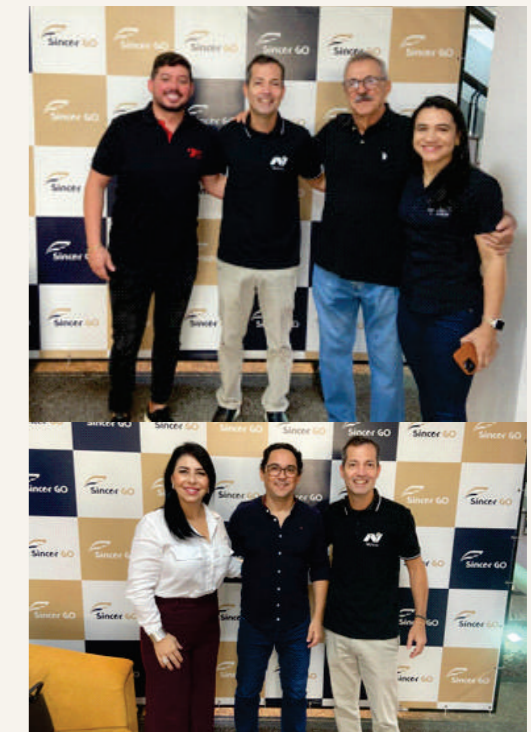
O Espaço Sincor foi o local escolhido para encontro da NUVO ASSESSORIA e a SUHAI SEGURADORA com os Corretores de Seguros.